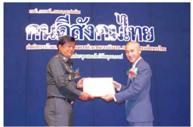
ตรวจเยี่ยมและอำลาหน่วย : พล.อ.สนธิ บุญยรัตกลิน ผบ.ทบ. ตรวจเยี่ยม นสร. เนื่องในโอกาสเกษียณอายุราชการ โดยมี พล.ท.สมเกียรติ สุทธิไวยกิจ ผบ.นสร. ให้การต้อนรับ เมื่อ ๖ ก.ย. ๕๐