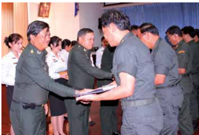
หลักสูตร ผกท.พิเศษ รุ่นที่ ๒๖ : พล.ท.สมเกียรติ สุทธิไวยกิจ ผบ.นสร. เป็นประธานปิดการฝึกอบรมผู้กำกับนักศึกษาวิชาทหารพิเศษ รุ่นที่ ๒๖ ณ ห้องมัทนะพาธา เมื่อ ๒๒ ต.ค. ๕๐