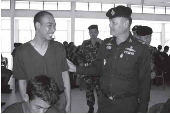
พล.ต.สิงห์ศึก สิงห์ไพร รอง ผบ.นสร.(๒) ตรวจเยี่ยมหลักสูตรปฐมนิเทศนายทหารชั้นประทวนสายสัสดี ณ รร.การกำลังสำรอง ศสร. เมื่อ ๑๒ ก.ย. ๕๐

๑. วิชาหลัก ถือเป็นหัวใจสำคัญของเจ้าหน้าที่ในสายงานสัสดี ประกอบด้วย วิชาการสัสดี วิชาการกฎหมายว่าด้วยการ