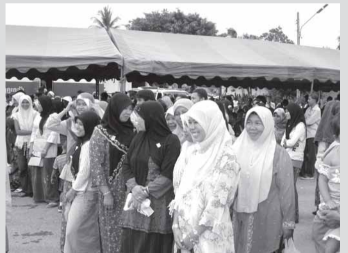
บรรดาญาติพี่น้องของทหารกองหนุน จชต. เดินทางมาส่งที่หน่วยรับพล ด้วยใบหน้ายิ้มแย้ม ก่อนเดินทางต่อไปยังหน่วยฝึกฯ

๓. เนื่องจากการดำเนินการเรียกพลในครั้งนี้ เป็นการเรียกพลเพื่อฝึกวิชาทหารในกรณีพิเศษ ประกอบกับหน่วยเรียกพลทั้งหมดทหารบกที่ ๔๒ และจังหวัดทหารบกปัตตานี ไม่เคยเรียกพลจำนวนมากในลักษณะเช่นนี้มาก่อน ทำให้ได้รับบทเรียนและประสบการณ์ใหม่ ๆ จากการดำเนินการเป็นอย่างมาก ตั้งแต่ขั้นตอนการตรวจสอบสภาพทหารกองหนุน, การส่งหมายเรียกพล, การรักษาความปลอดภัย ทั้ง