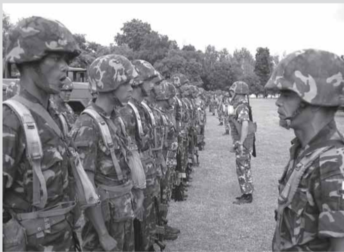
การฝึกอบรม: ทบพว.วิชาทหาร ฝึกวิชาเพิ่มเติม และเน้นย้ำอุดมการณ์ความรักชาติ พร้อมทั้งการให้ข่าวสารกับทางราชการ

ถึงแม้ว่าโครงการนี้จะเป็นโครงการที่ต้องดำเนินการควบคู่ไปกับการดำเนินการตามแผนการเรียกพลเพื่อตรวจสอบ และฝึกวิชาทหารปี ๕๐ อีกทั้งระยะเวลาในการเริ่มดำเนินการล่าช้ากว่าหัวงเวลาที่กำหนดไว้ เนื่องจากข้อจำกัดทางด้านงบประมาณ แต่ผลที่ได้รับนับว่าได้ประโยชน์เป็นอย่างมากดังพอสรุปให้เห็นได้ดังนี้