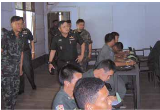
ตรวจการฝึก นศท. ภาคที่ตั้ง : พล.ต.อภิชัย ทิณสายแก้ว รอง ผบ.นสร. (๑) ตรวจการฝึกภาคที่ตั้งปกติ นศท. ณ ศฝ.นศท.มทบ.๒๑ (จว.ขอนแก่น) และ ศฝ.นศท.มทบ.๒๔ (จว.อุดรธานี) เมื่อ ๑๘ ก.ค. ๕๐