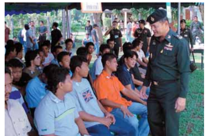
เรียกพลกองหนุน ๑๐ รุ่นปี จชต. : พล.ต.สิงห์ศึก สิงห์ไพร รอง ผบ.นสร. (๒) ตรวจเยี่ยมการเรียกพลกองหนุน ๑๐ รุ่นปี ณ จังหวัดทหารบกปัตตานี เมื่อ ๓ ก.ค. ๕๐