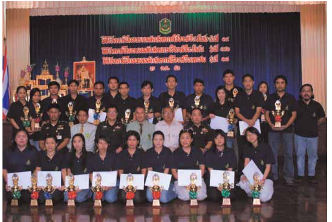
หลักสูตรการใช้อาวุธปืน รร.เสนารักษาดินแดน : พล.ต.ชนดล เผ่าจินดา เสธ.นสร. เป็นประธานปิดการฝึกอบรมหลักสูตรการใช้อาวุธปืนขั้นต้น รุ่นที่ ๑๐๖ และหลักสูตรการใช้อาวุธปืนขั้นสูง รุ่นที่ ๑๔ ณ ห้องมัทนะพาธา อาคารสวนเจ้าเชตุ เมื่อ ๑๖ ต.ค. ๕๐