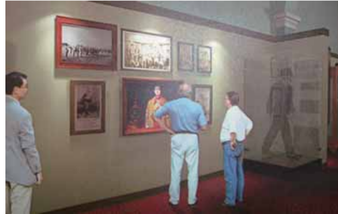
ภาพจำลองพิพิธภัณฑ รัชกาลที่ ๖ ภายหลังจากการปรับปรุง

ในส่วนของการจัดแสดงใหม่ รวมทั้งวางผังพื้นที่จัดแสดงใหม่ โดยแบ่งเป็นสัดส่วน ได้แก่ ห้องจัดแสดงการเทิดพระเกียรติองค์สมเด็จพระ