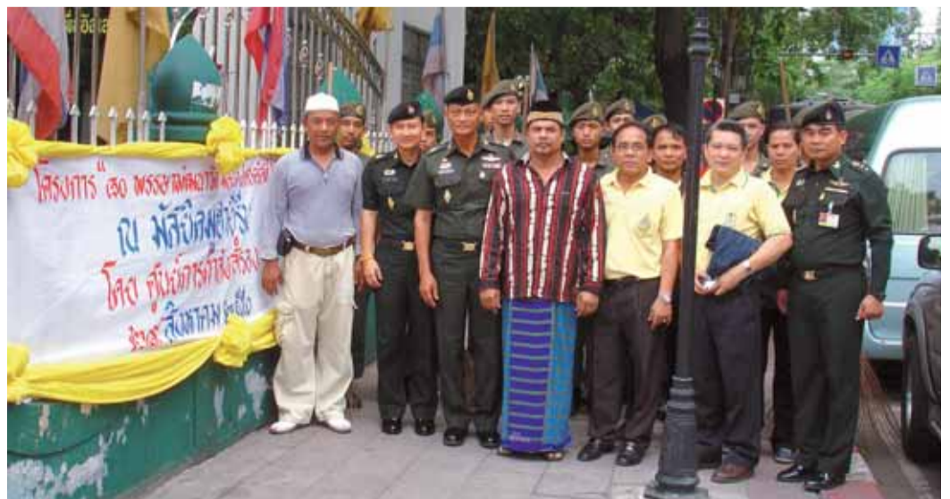
ผบ.นสร.พบปะนักเรียนนายอำเภอ : พล.ท.สมเกียรติ สุทธิไวยกิจ ผบ.นสร. พบปะนักเรียนนายอำเภอ รุ่นที่ ๖๔ จำนวน ๘๐ คน ซึ่งกรมการปกครองส่งเข้ารับการอบรมหลักสูตร ผบ.ร้อย.อส. รุ่นที่ ๓๘ ณ ห้องมัทนะพาธา อาคารสวนเจ้าเชตุ เมื่อ ๑ ส.ค. ๕๐